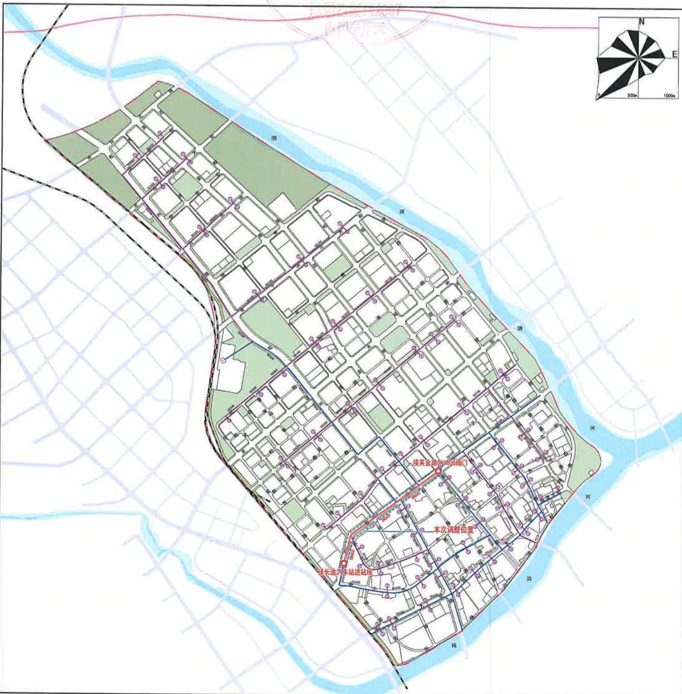
供热工程规划图(调整后)