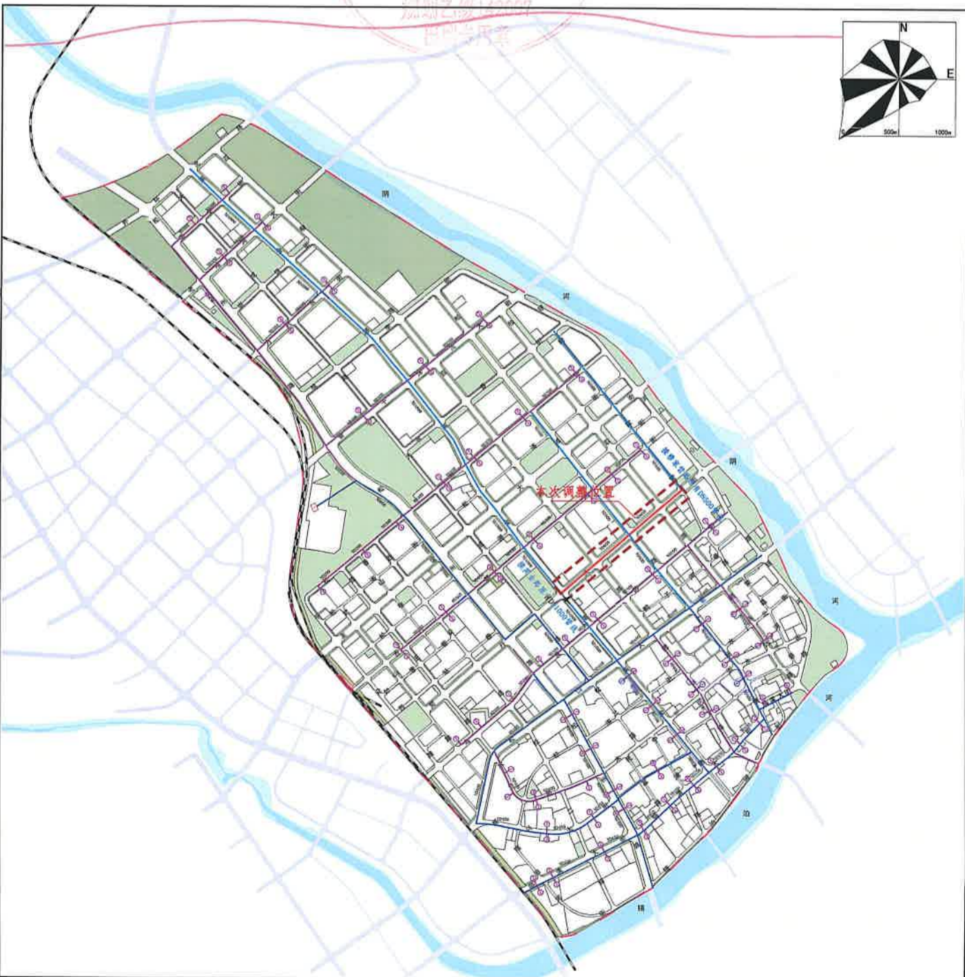
供热工程规划图(调整后)