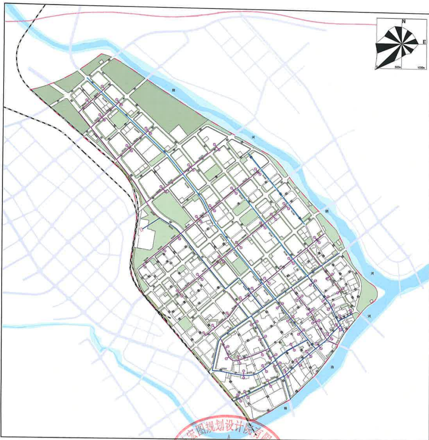
供热工程规划图(调整前)