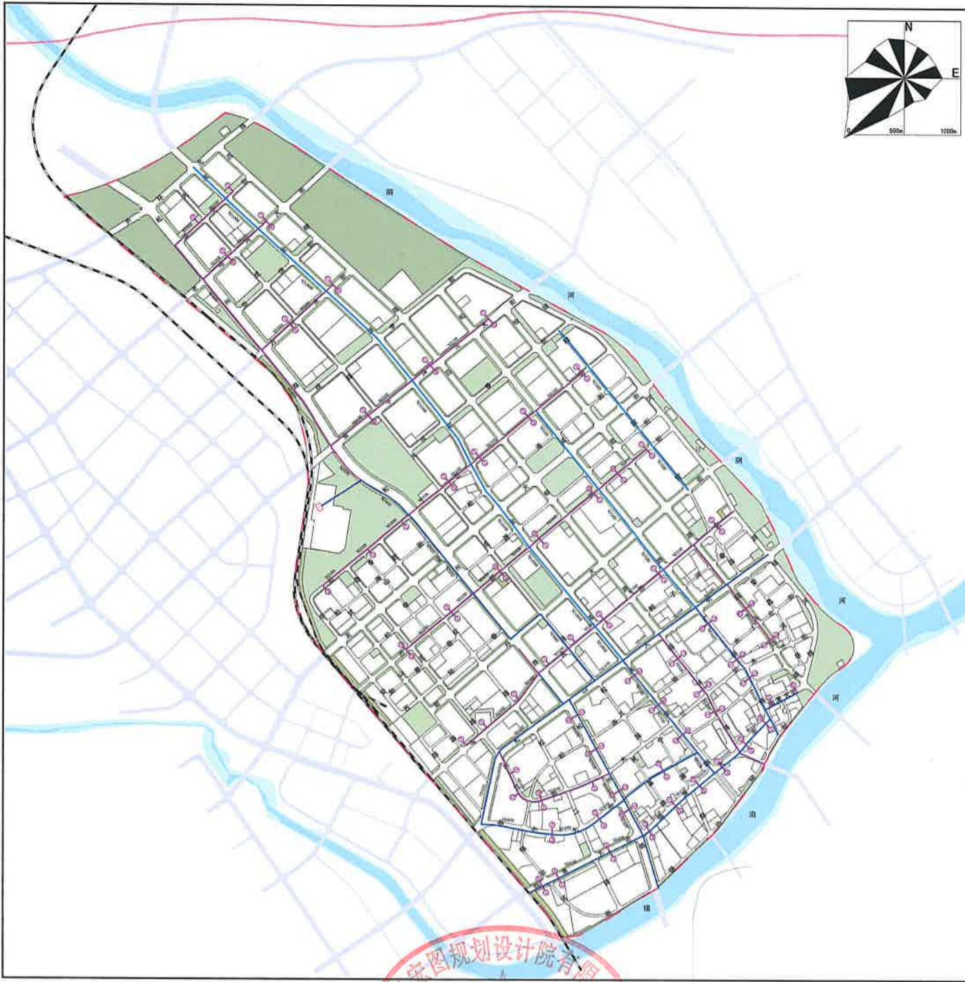
供热工程规划图(调整前)